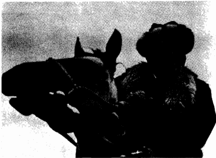
جنکيز ايتمانوف مع شغيلة الريف القرغيزيين